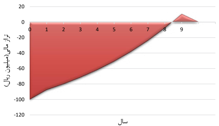
شکل ۳. روند تراز مالی استفاده از آبگرمکن خورشیدی با هزینه شهروندان