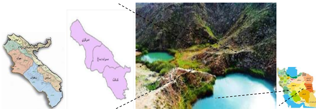
شکل ۱. موقعیت دریاچه دوقلو (سیاه‌گاو) در ایران و شهرستان آبدانان (۱)

کارشناسان ۳۸ سال بوده است. بیشترین بازدیدکنندگان بین سنین ۳۰ تا ۴۰ سال بودند یعنی ۳۶ درصد از بازدیدکنندگان از دریاچه. همچنین افراد بیشتر از ۵۰ سال کمترین درصد، یعنی ۴/۸۱ درصد از کل بازدیدکنندگان را تشکیل می‌دادند. به ترتیب ۲۵ و ۴۸ درصد از کارشناسان و بازدیدکنندگان را زنان تشکیل می‌دادند. شغل ۹۷/۵ درصد از کارشناسان دولتی و ۲/۵ درصد بازنشسته بوده‌اند. در بین گردشگران ۲۷ درصد شغل آزاد، ۱۱ درصد شغل دولتی، ۵ درصد بازنشسته، ۳۲ درصد دانشجویان و دانش‌آموزان و ۲۵ درصد زنان خانه‌دار بوده‌اند که با توجه به این موارد بیشترین گروه بازدیدکننده از دریاچه را افراد در حال تحصیل تشکیل می‌دهند. پس از آن درآمد متوسط بررسی شده است که بیشترین درصد درآمدی کارشناسان مربوط به افرادی بوده است که بین سه تا پنج میلیون درآمد داشته‌اند (۴۰ درصد افراد). همچنین، بیشترین فراوانی درآمد میان یک تا سه میلیون تومان ۳۸/۵۵ درصد گردشگران را به خود اختصاص داده است. میزان تحصیلات نیز در تحقیق حاضر بررسی شده است که ۶۲ درصد کارشناسان دارای مدرک کارشناسی بوده‌اند و ۳۰ درصد نیز مدرک تحصیلی بالاتر از کارشناسی داشته‌اند. در بین بازدیدکنندگان نیز ۳۵ درصد افراد دارای مدرک کارشناسی و ۱۹ درصد بالاتر از کارشناسی بوده‌اند. همچنین، نتایج اولویت‌بندی موانع توسعه گردشگری از نظر کارشناسان و گردشگران در جدول ۲ ارائه شده است که چهار گزینه مناسب نبودن راه‌های ارتباطی و شبکه حمل‌ونقل، نامناسب بودن امکانات بهداشتی و نبود استراحتگاه در نزدیکی دریاچه، ضعف مدیریت گردشگری و عدم هماهنگی سازمان‌های مرتبط با این