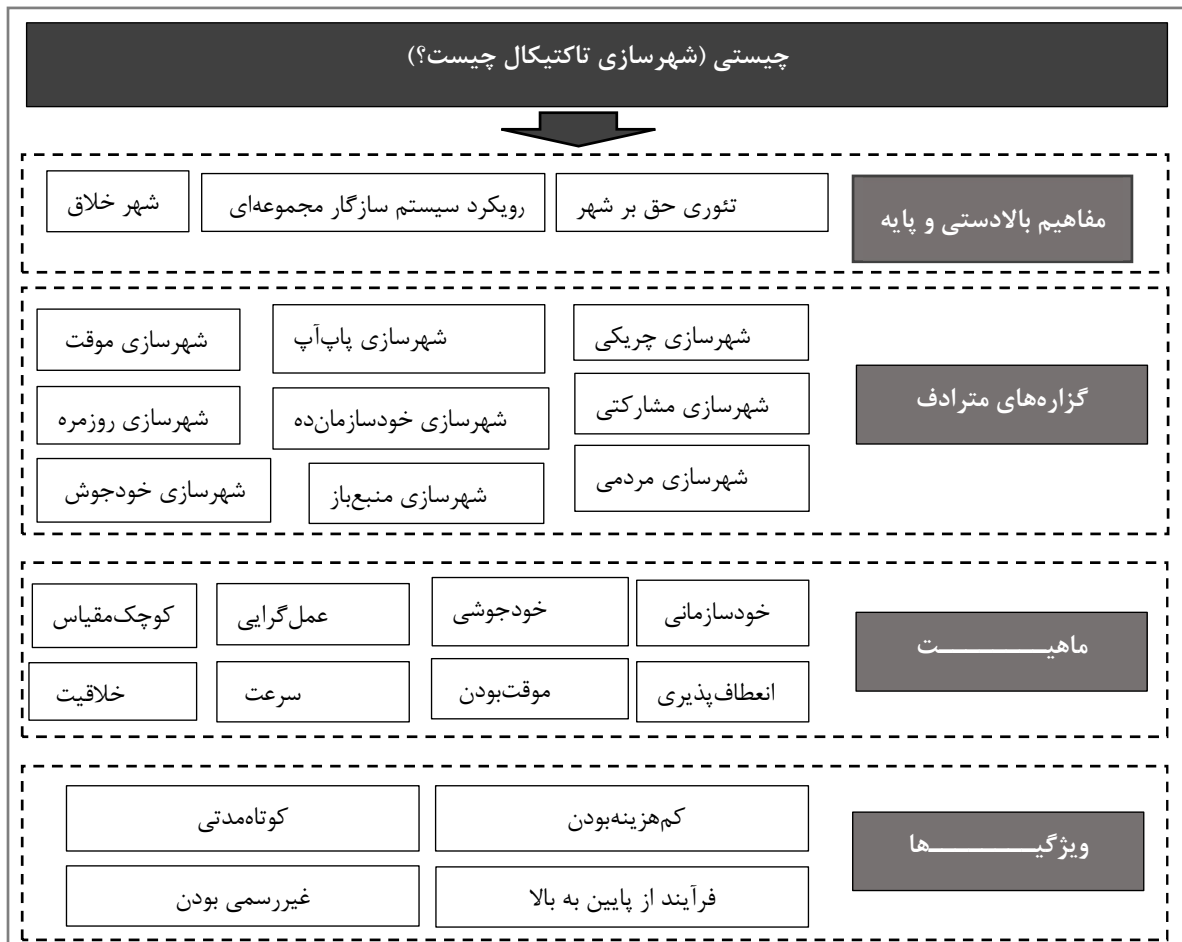
تصویر ۲. خلاصه کدها و تم‌ها در مقوله «چیستی» شهرسازی تاکتیکال