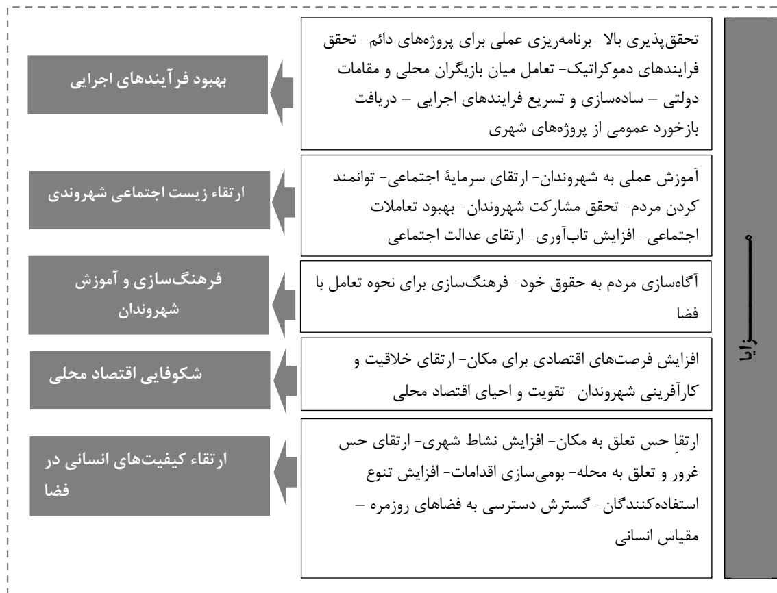
تصویر شماره ۳- خلاصه کدها و تم های حاصل از تحلیل محتوا در مقوله «چرایی» شهرسازی تاکتیکی